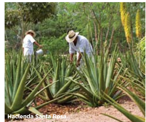
Hacienda Santa Rosa