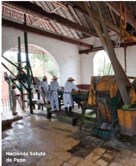
Hacienda Sotuta de Peón